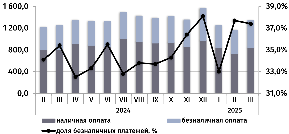
динамика потребительского рынка, ежемесячно (в текущих ценах, млн руб.)