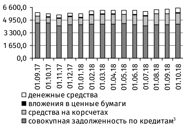
Рис. 3. Динамика основных видов активов, млн руб.

В результате сложившейся динамики срочная депозитная база банковской системы в целом увеличилась на 20,0 млн руб. (+0,5%), до 3 664,1 млн руб., а онкольные обязательства сократились на 34,1 млн руб. (-1,4%), до 2 389,0 млн руб. (рис. 2).