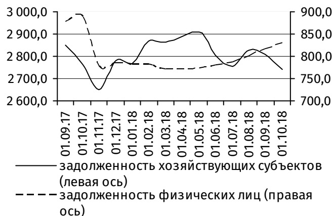
Рис. 4. Динамика задолженности по кредитам, 3 млн руб.