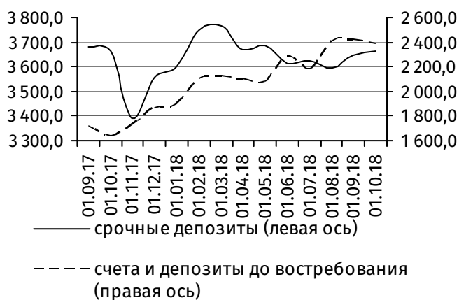
Рис. 2. Динамика депозитной базы, млн руб.

Отсутствием выраженной динамики характеризовалась и клиентская база 2 , размер которой сложился практически на уровне предыдущего месяца, составив на 1 октября 5 906,4 млн руб. (-14,1 млн руб., или -0,2%). При этом в её структуре зафиксировано сокращение остатков на счетах юридических лиц на 33,4 млн руб. (-0,9%), до 3 495,3 млн руб., преимущественно вследствие оттока средств с депозитов до востребования (-32,2 млн руб., до 1 790,7 млн руб.).