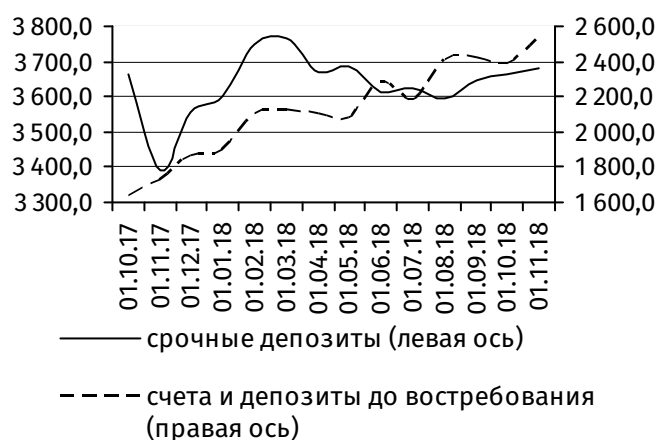
Рис. 2. Динамика депозитной базы, млн руб.

Величина клиентской базы 2 возросла на 152,3 млн руб. (+2,6%), до 6 058,7 млн руб. Основу данной динамики сформировал приток средств юридических лиц на текущие счета на 135,0 млн руб. (+7,5%), до 1 925,6 млн руб., тогда как их срочные депозиты сократились на 14,1 млн руб. (-0,8%), до 1 690,5 млн руб.