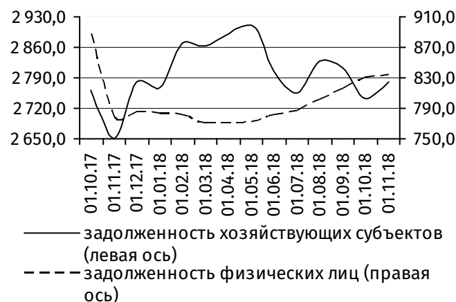
Рис. 4. Динамика задолженности по кредитам, 3 млн руб.