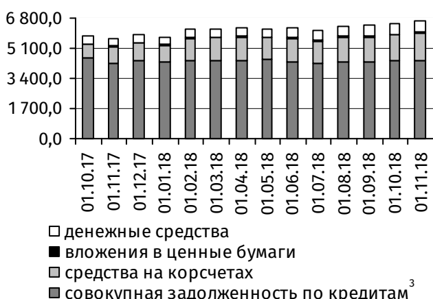
Рис. 3. Динамика основных видов активов, млн руб.

В результате сложившейся динамики онкольные обязательства банковской системы в целом увеличились на 138,4 млн руб. (+5,8%), до 2 527,4 млн руб., срочная депозитная база – на 13,9 млн руб. (+0,4%), до 3 678,0 млн руб. (рис. 2).