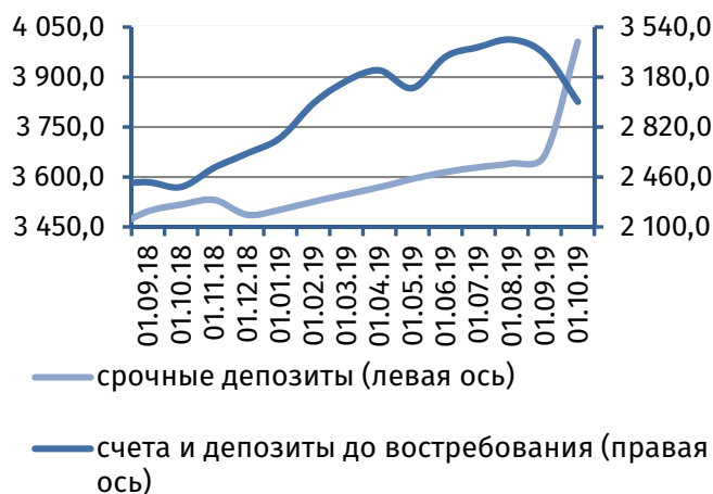
Рис. 2. Динамика депозитной базы, млн руб.

По сравнению с началом сентября совокупный объём клиентской базы 2 незначительно сократился (на 1,5 млн руб.), сложившись на 1 октября на уровне 7 008,3 млн руб. При этом сжатие онкольных обязательств на 342,1 млн руб. (-10,2%), до 3 002,1 млн руб., было практически компенсировано расширением срочной депозитной базы на 340,6 млн руб. (+9,3%), до 4 006,2 млн руб. (рис. 2).