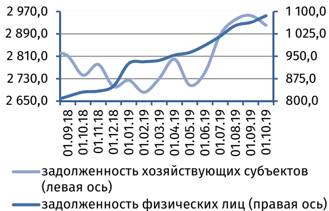
Рис. 4. Динамика задолженности по кредитам, 4 млн руб.

Результаты деятельности коммерческих банков республики в сентябре 2019 года характеризовались формированием чистой прибыли на уровне 13,5 млн руб. (в августе – 26,6 млн руб.).