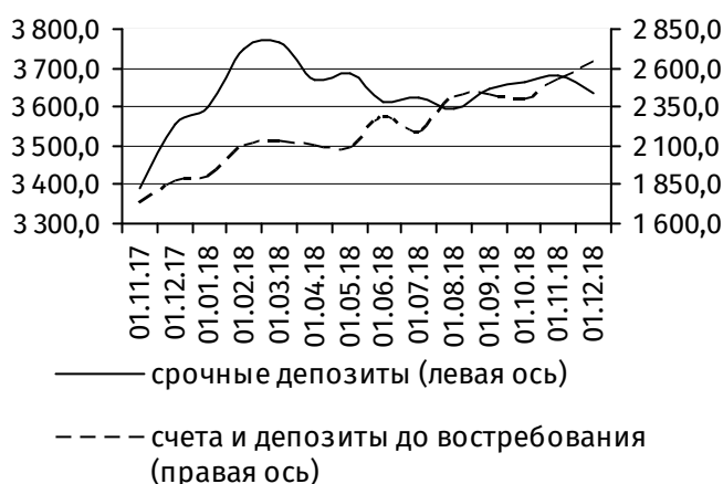
Рис. 2. Динамика депозитной базы, млн руб.

Величина клиентской базы 2 возросла на 59,4 млн руб. (+1,0%), до 6 118,1 млн руб.