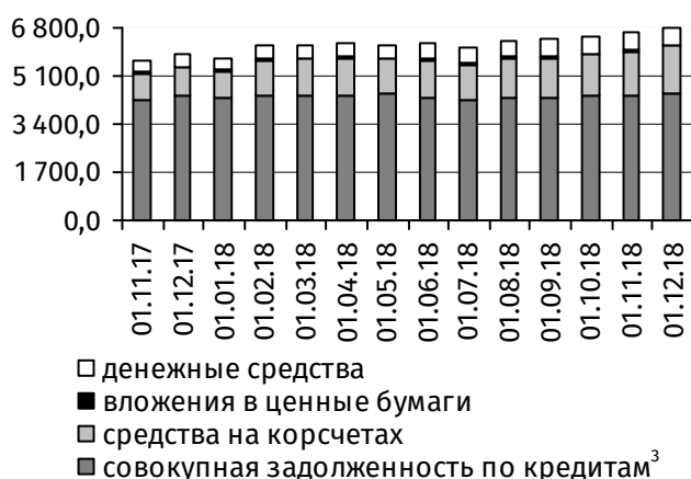
Рис. 3. Динамика основных видов активов, млн руб.

В целом онкольные обязательства банковской системы за ноябрь увеличились на 104,0 млн руб. (+4,1%), до 2 631,4 млн руб., а срочная депозитная база, напротив, сократилась на 44,6 млн руб. (-1,2%), до 3 633,4 млн руб. (рис. 2).