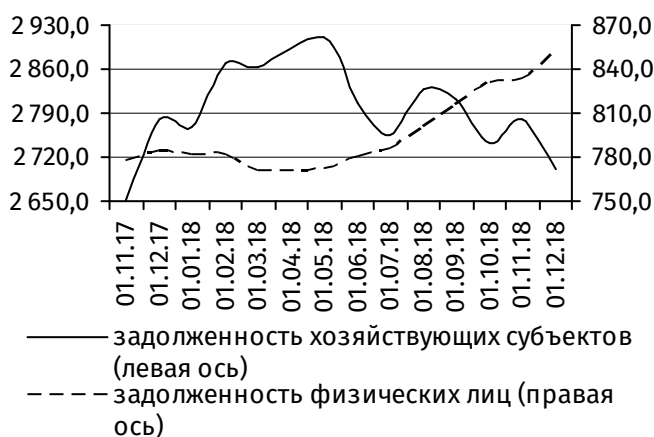
Рис. 4. Динамика задолженности по кредитам, 3 млн руб.

В активной части баланса банковской системы фиксировался рост суммы денежных средств, размещённых на корреспондентских счетах коммерческих банков, – на 148,6 млн руб. (+9,7%), до 1 682,4 млн руб., тогда как остатки наличных денег в кассах