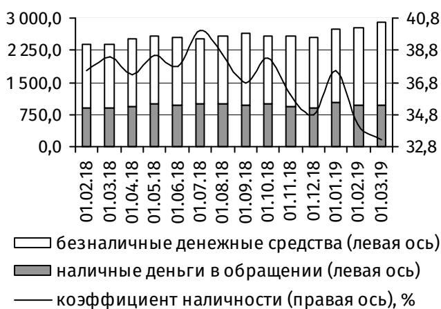
Рис. 1. Динамика национальной денежной массы, млн руб.

Денежная масса, номинированная в иностранной валюте, уменьшилась на 24,4 млн руб. (-0,4%), до 5 875,3 млн руб. Степень валютизации совокупного денежного предложения составила 66,9% (-1,0 п.п.).