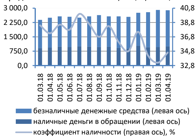
Рис. 1. Динамика национальной денежной массы, млн руб.

Денежная масса, номинированная в иностранной валюте, возросла на 292,1 млн руб. (+5,0%), до 6 167,3 млн руб. Степень валютизации совокупного денежного предложения составила 68,1% (+1,2 п.п.).