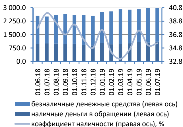
Рис. 1. Динамика национальной денежной массы, млн руб.

Денежная масса, номинированная в иностранной валюте, сократилась на 192,3 млн руб. (-3,1%), до 6 032,6 млн руб. Степень валютизации совокупного денежного предложения составила 65,9% (-1,7 п.п.).