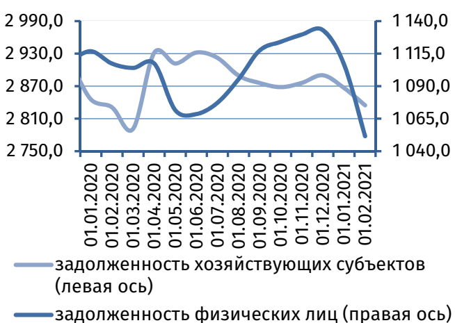
Рис. 4. Динамика задолженности по кредитам, 2 млн руб.

По итогам первого месяца 2021 года коммерческими банками была сформирована чистая прибыль в сумме 9,2 млн руб. (в январе 2020 года – 15,2 млн руб.).