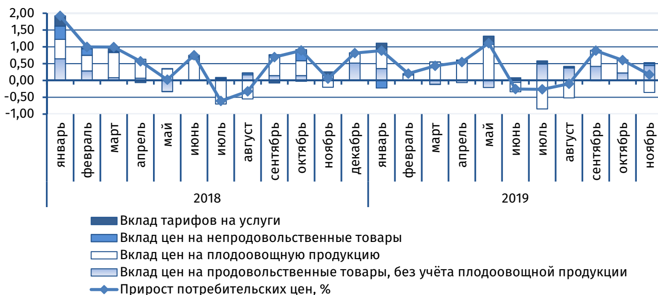
Рис. 1. Вклад основных компонент в сводный индекс потребительских цен, п.п.

Увеличением стоимости также характеризовались макаронные (+0,4%) и крупяные (+1,4%) изделия, алкогольная продукция: коньяк (+2,1%), водка и ликёро-водочные изделия (+1,8%), вина (+0,7%).