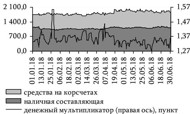
Рис. 30. Динамика широкой денежной базы и денежного мультипликатора, млн руб.

Объём обязательств центрального банка по выпущенным наличным денежным средствам сократился на 31,5 млн руб. (-2,8%) до 1 108,7 млн руб., в основном за счёт сокращения остатков наличности в кассах кредитных организаций на 52,0 млн руб. (-32,9%), до 105,8 млн руб. В результате наблюдалось ослабление доминирующей позиции наличной составляющей в структуре денежной базы на 1,6 п.п., до 54,5%. Вследствие более активного расширения национальной денежной массы по сравнению с динамикой денежной базы денежный мультипликатор 38 увеличился с 1,33 до 1,36 на конец отчётного периода (рис. 30).