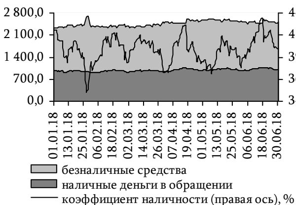
Рис. 28. Динамика национальной денежной массы и коэффициента наличности, млн руб.

Расширению денежного агрегата М2х в отчётном периоде способствовало пополнение текущих счетов и срочных депозитов до 1 380,7 млн руб. (+11,4%) и 123,2 млн руб. (+9,8%) соответственно. Всего в безналичном сегменте на 1 июля 2018 года сосредоточено 1 505,0 млн руб., или 60,0% национальной денежной массы (57,9% на начало года, 53,2% – на 01.07.2017). Объём наличных денежных средств, находящихся в обращении вне касс кредитных организаций, увеличился на 20,5 млн руб. (+2,1%) и на 1 июля 2018 года составил 1 002,9 млн руб. (рис. 28), что было связано в основном с активной выдачей денежных средств в июне ввиду начала отпускного периода. В целом объём обращающейся денежной наличности в I полугодии 2018 года был достаточно стабилен.