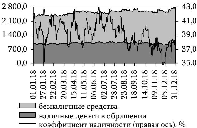
Рис. 24. Динамика национальной денежной массы и коэффициента наличности, млн руб.

Денежная масса в иностранной валюте, сложившись на уровне 5 372,0 млн руб., возросла на 5,3%, или на 272,2 млн руб., а без учёта валютной переоценки (девальвация составила 3,9%) – на 1,4%. Основное влияние на её динамику оказало увеличение остатков наличной иностранной валюты в кассах банков в номинальном выражении на 59,2%, до 335,7 млн руб., а также приток средств на депозиты до востребования на 5,1%, до 1 579,3 млн руб. Вместе с тем срочные депозиты возросли на 2,0%, до 3 418,0 млн руб.