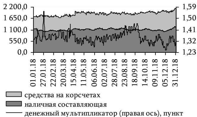
Рис. 26. Динамика широкой денежной базы и денежного мультипликатора, млн руб.

Вследствие более активного расширения денежной базы по сравнению с динамикой национальной денежной массы денежный мультипликатор 26 на 1 января 2019 года составил 1,28 против 1,33 на начало 2018 года (рис. 26).