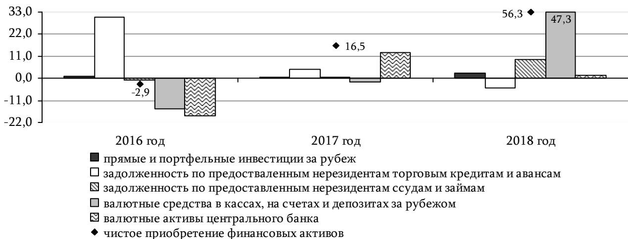
Рис. 4. Динамика активов резидентов ПМР в 2016-2018 гг., млн долл.

Внешнеэкономические операции с портфельными инвестициями в 2018 году не проводились. В базисном году по данному разделу платёжного баланса наблюдался незначительный нетто-отток средств в результате чистого приобретения организациями нефинансового сектора Приднестровья иностранных активов в форме долевых ценных бумаг в размере 5,3 тыс. долл.