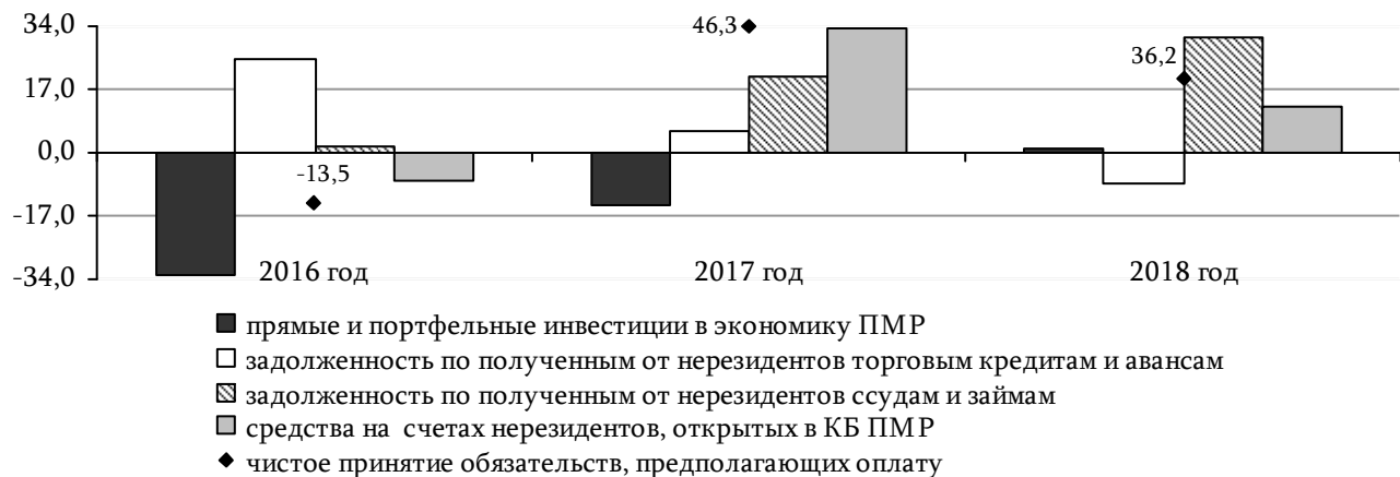
Рис. 3. Динамика обязательств резидентов ПМР в 2016-2018 гг., млн долл.

Финансирование приднестровской экономики осуществлялось за счёт привлечения иностранного заёмного капитала для кредитования хозяйствующих субъектов республики и притока средств на банковские счета и депозиты нерезидентов. Изменения основных статей активов и пассивов отражены на рисунках 3 и 4.