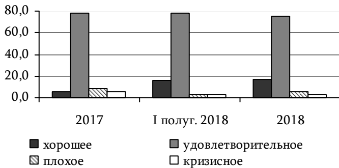
Рис. 18. Оценка финансового положения, % к общему количеству респондентов

из прибыли чистый финансовый результат в 2018 году сложился положительным (в 2017 году фиксировался убыток), а по сравнению с 2016 годом сформировался рост в 2,2 раза (табл. 12). В основу повышательного тренда в отчётном периоде легло наращивание чистой прибыли предприятий, работающих в сфере торговли, операций с недвижимым имуществом, промышленного и сельскохозяйственного производства.