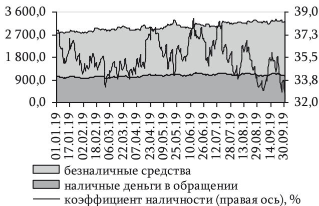
Рис. 42. Динамика национальной денежной массы и коэффициента наличности, млн руб.

Основным фактором расширения денежного агрегата М2х в отчётном периоде стало пополнение текущих счетов и срочных депозитов до 1 959,1 млн руб. (+24,6%) и до 222,4 млн руб. (+47,9%) соответственно. Всего в безналичном сегменте на 1 октября 2019 года сосредоточено 2 182,8 млн руб., или 67,8% национальной денежной массы (62,5% на начало года, 61,7% – на 01.10.2018). Объём наличных денежных средств, находящихся в обращении вне касс кредитных организаций, увеличился всего на 4,3 млн руб. (+0,4%) и на 1 октября 2019 года составил 1 038,7 млн руб. (рис. 42).