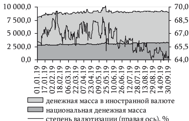
Рис. 43. Динамика полной денежной массы и коэффициента валютизации, млн руб.