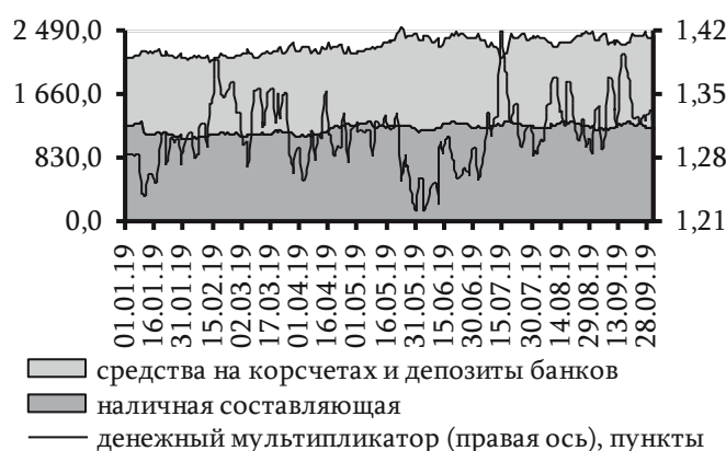
Рис. 44. Динамика широкой денежной базы и денежного мультипликатора, млн руб.

Основное влияние на прирост обязательств центрального банка оказало повышение остатков средств, размещённых на корреспондентских счетах коммерческих банков в ПРБ, на 338,4 млн руб. (+38,3%), до 1 223,2 млн руб. В их числе неснижаемый остаток в фондах обязательного резервирования и страхования увеличился на 104,2 млн руб. (+15,6%) и составил 770,8 млн руб., что обусловлено ростом объёма привлечённых средств, являющихся расчётной базой. В целом на средства на корреспондентских счетах пришлось 49,8% денежной базы (41,2% на 01.01.2019)