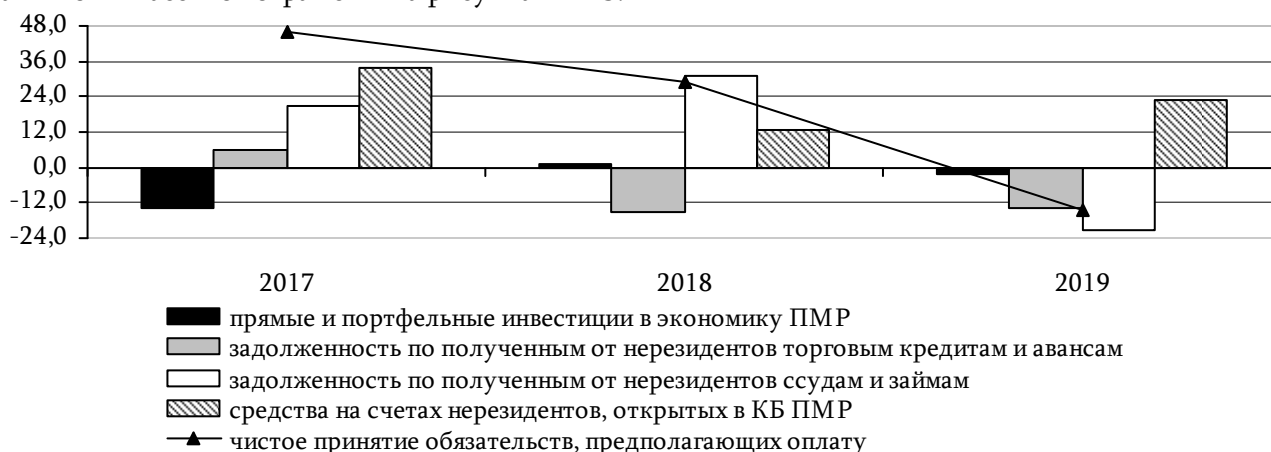
Рис. 2. Динамика обязательств резидентов ПМР в 2017-2019 гг., млн долл.

Чистое кредитование остального мира было обеспечено в основном операциями центрального банка, который нарастил свои иностранные активы на 31,5 млн долл., и прочих секторов экономики, главным образом вследствие снижения внешних обязательств по ранее привлечённым кредитам и займам (на 21,5 млн долл.), а также погашения коммерческой задолженности за товары, работы и услуги (на 13,8 млн долл.). Изменения основных статей активов и пассивов отражены на рисунках 2 и 3.