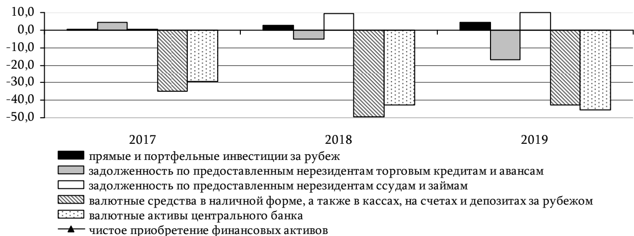
Рис. 3. Динамика активов резидентов ПМР в 2017-2019 гг., млн долл.

По операциям с портфельными инвестициями незначительный нетто-приток валютных средств в 2019 году (в размере 10,3 тыс. долл.) был обусловлен сокращением активов нефинансовых организаций республики, размещённых в иностранных долевых ценных бумагах. В сравниваемом периоде зарегистрировано нулевое сальдо баланса портфельных инвестиций ввиду отсутствия операций по данному виду финансовых инструментов.