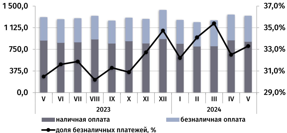
динамика потребительского рынка, ежемесячно (в текущих ценах, млн руб.)