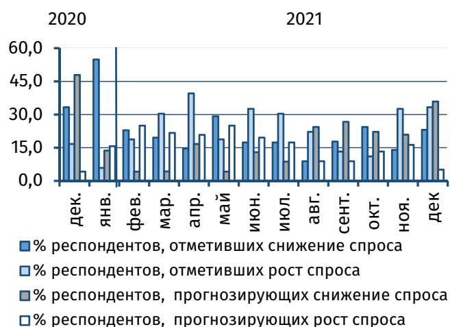
Рис. 2. Оценка текущего и прогнозного уровня спроса, % от общего числа респондентов

Ценовые ожидания руководителей характеризовались преобладанием нейтральных оценок. В то же время рост себестоимости производства в январе прогнозируют 25,6% опрошенных (-9,3 п.п. к предыдущему месяцу), а повышение отпускных цен планируют на 15,4% предприятий (-0,9 п.п.). При этом увеличилась доля менеджеров, оценивающих вероятность снижения в январе как себестоимости (с 2,3% до 10,3%), так и цен на конечную продукцию (с 2,3% до 12,8%).