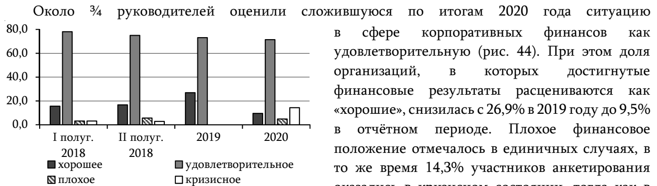
Рис. 44. Оценка финансового положения, % к общему количеству респондентов

стало упрощение/перенос сроков сдачи отчётности, которую отметили 47,5% участников анкетирования. Возможностью получения льготных кредитов и реструктуризацией/продлонгацией кредитов воспользовались 14,3% респондентов. Остальные меры с учётом специфики деятельности предприятий применялись реже. При этом многие организации не были осведомлены о предлагаемых мерах, в связи с чем не пользовались ими.